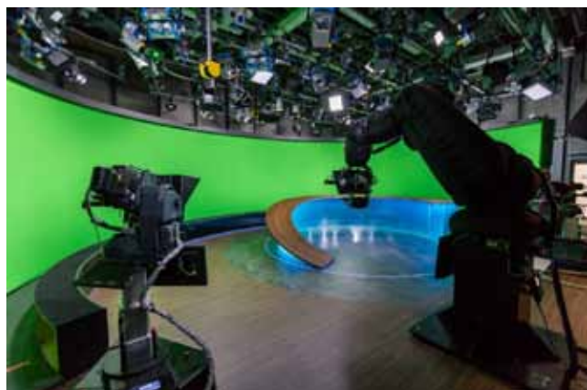
Abb. 2: Studio für BR Rundschau mit Kamera-robotern

Die starke Veränderung der technischen Möglichkeiten ist auch verbunden mit einer deutlichen Veränderung der Nutzergewohnheiten, insbesondere der 14- bis 29-Jährigen. Der Abbildung 4 ist zu entnehmen, dass lineares Programm (noch) stark genutzt wird. So beläuft sich die Nutzungsdau-