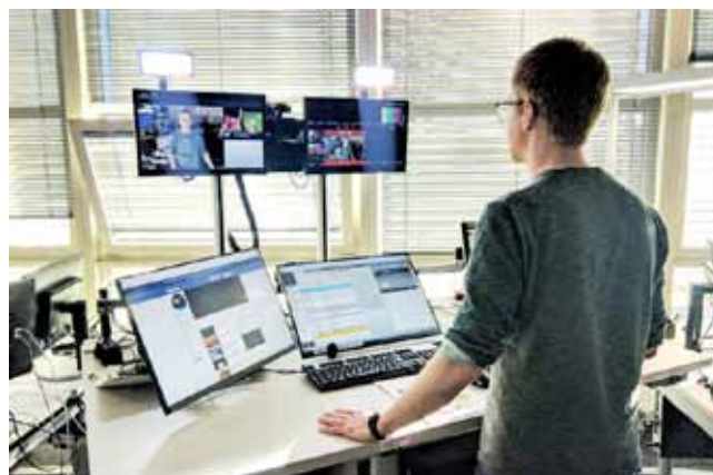
Abb.3: Assistierte Arbeitsumgebung für den Selbstfahrer am Moderationsplatz