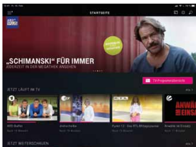
Startseite Magenta TV (iPad App)

nächsten Zeit einen Fokus darauf legen, sie programmlich und technisch zu stärken.